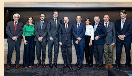
Imagen del día de la firma del acuerdo.

Taylor Wessing y Ecija cerraron su alianza estratégica el pasado mes de marzo. El acuerdo supone el aterrizaje de un despacho 'top 20' en Reino Unido en España de la mano de la firma presidida por Hugo Écija. El acuerdo ha dado como resultado una red combinada de más de 3.000 profesionales y 500 socios presentes en 62 oficinas repartidas por 32 jurisdicciones de todo el mundo.